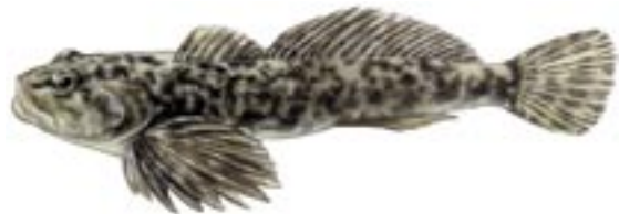
Koppe – Fisch des Jahres 2006

Seeforelle 1. Oktober bis 28. Februar (60 cm) Bachforelle 1. Oktober bis 28. Februar (26 cm) Regenbogenforelle 15. Dezember bis 15. April (26 cm) Huchen 15. Februar bis 31. Mai (70 cm) Seesaibling 1. Oktober bis 28. Februar (30cm) Bachsaibling 1. Oktober bis 28. Februar (20 cm) Äsche 1. Januar bis 30. April (35 cm) Zander 15. März bis 30. April (50 cm) Hecht 15. Februar bis 15. April (50 cm)