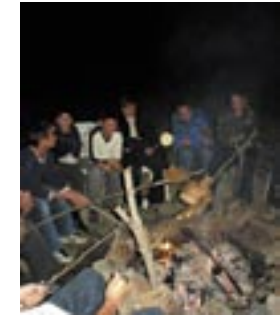
Die gefangenen Fische werden abends beim Zeltlager gegrillt und gegessen