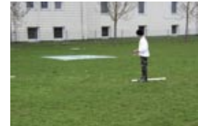
Casting Ziel-Weit-Wurf mit der Angel